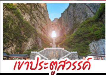
เขาประตูลั่วตี้