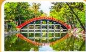
ศาลเจ้าซูมิโยชิ โทคะ