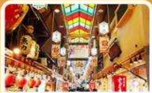
ตลาดปลา นิชิกิ