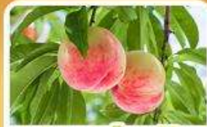
กิจกรรมเก็บผลไม้