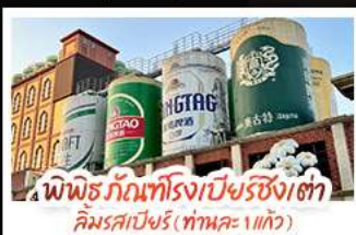
พิพิธภัณฑ์โรงเบียร์ชิงเต่า คิมรคเบียร์ (ทานคะ 1 แก้ว)