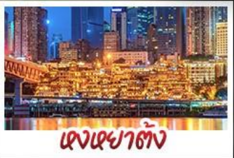
แดงเซาตั้ง