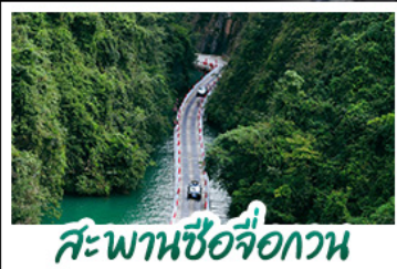
สะพานชื้อจื้อกวน