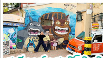
สตรีทอาร์ต สตุตโฮจิบลิ