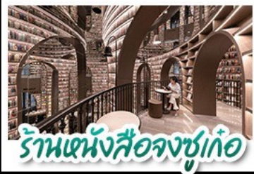
ร้านหนังสือจชู่เก๋อ

อุทยานสี่ดรุณี - อุทยานน้ำแข็งโกว - วัดต้าฉือ หนีแพนตันออนเซลฟ์ - ร้านหนังสือจชู่เก๋อ ถนนโบราณชอยกว้างชอยแคบ ช้อปปิ้งถนนไท่กู่หลี่ + ถนนชุนชู่ CHENGDU TIMES OUTLETS