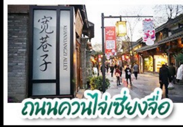
ถนนควนน้ำจี่เซียงจื่อ