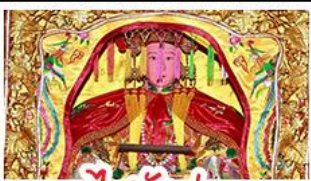
ไต้ตังมา

มรดกโลกบ้านดินถู่โหลวเถียนโหลวเคิง - สะพานเซียงจิว ไต้ตังมา (เจ้าแม่กบกับทิม) - เอียงบูชิว (เจ้าพ่อเสือ) พระเจ้าตากสินมหาราช - อวนน้ำแร่จากธรรมชาติ ไม่ลงร้านช้อปปิ้ง - พักโรงแรม 4 ดาว เมนูพิเศษ!!! อาหารแต้จิ๋ว 18 อย่าง, สุกี้ซีฟู้ด ผ่านพะไลต้นตำรับแต้จิ๋ว