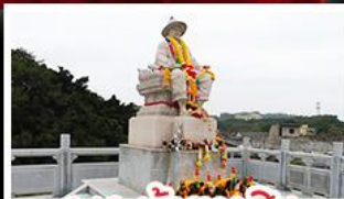
พระเจ้าตากสิน