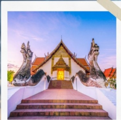
วัดกุสินทร์