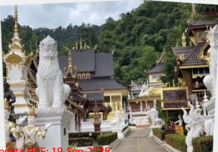
วัดป่าเซตวัน