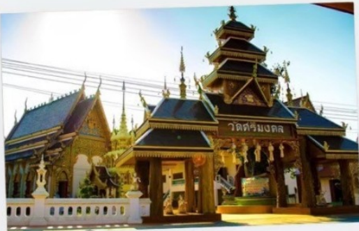
วัดศรีมงคล (วัดก้าง)