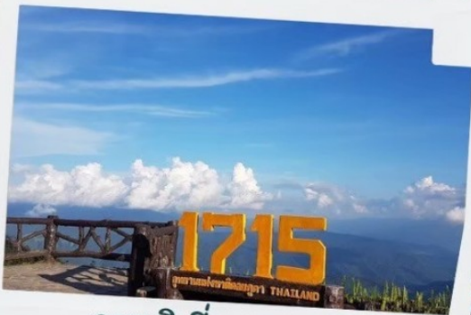
จุดชมวิวที่ความสูง 1715