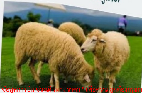
ฟาร์มแกะ