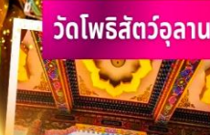
วัดโพธิสัตว์อุลาน