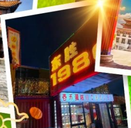
ถนนคนเดินคังบาร์ซี