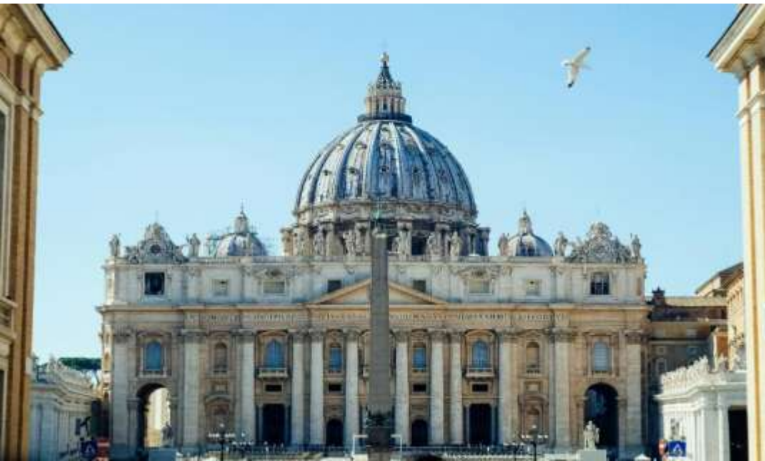
มหาวิหารนักบุญปีเตอร์ ( ST. PETER' BASILICA)

(กรณีมีพิธีด้านใน หรือถ้าหากมีผู้เข้าชมเป็นจำนวนมากจนไม่สามารถเข้าชมได้ทันเวลา ทั้งนี้เพื่อมิให้กระทบต่อกำหนดการท่องเที่ยวอื่นๆ ภายในโปรแกรมทัวร์" อาจจะไม่ได้รับการเข้าชม)