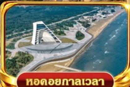
หอดอยกาลเวลา