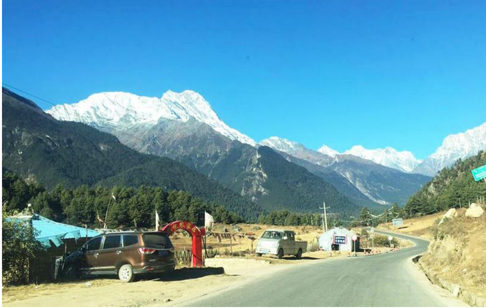
พาท่านเดินทางสู่ด่านพรมแดน จีน-เนปาล ใช้เวลาเดินทาง 1 ชั่วโมงโดยประมาณ