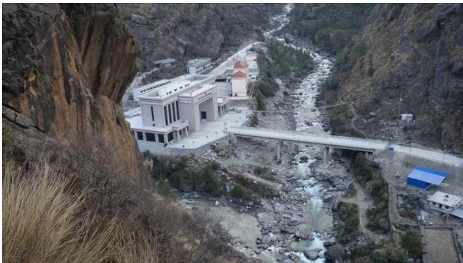
ถึง ด่านพรมแดน พาท่านเดินทางตรวจคนเข้าเมืองโดยการเข้าเนปาลสำหรับคนไทยต้องใช้วีซ่า