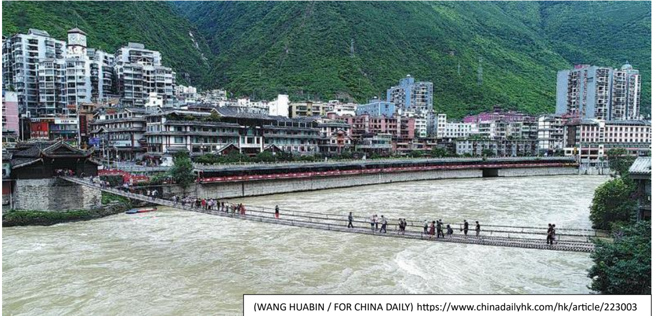
(WANG HUABIN / FOR CHINA DAILY) https://www.chinadailyhk.com/hk/article/223003

แลกเปลี่ยนทางวัฒนธรรมและเศรษฐกิจในเขตเสฉวน-ทิเบต พระราชทานพระบรมราชานุมัติให้สร้างสะพานนี้ขึ้นในปี ค.ศ. 1705 แล้วเสร็จในปี 1706