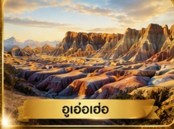
อุเอ้อเซ่อ