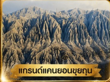
แกรนด์แคนยอนขุยถุน