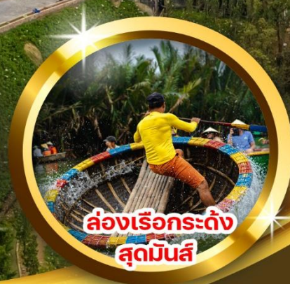
ล่องเรือกระดัง ลุดมินส์