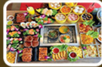
ปิ้งย่าง BBQ