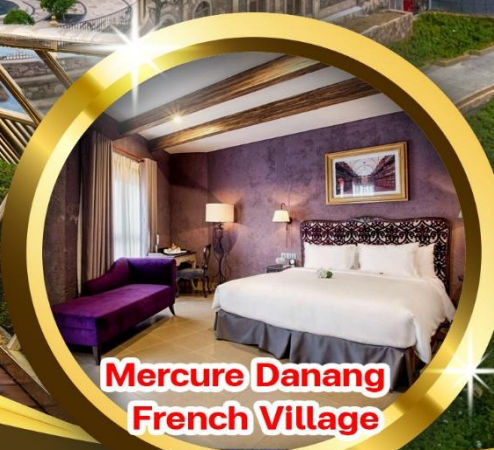
Mercure Danang French Village