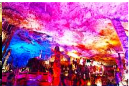
ถ้ำเก้าสวรรค์-อุทยานฟง

วันที่สาม เมืองจางเจียเจีย-ศูนย์แพทย์แผนจีน -ศูนย์จำหน่ายผลิตภัณฑ์ยาพารา-ถ้ำเก้าสวรรค์-อุทยานฟง เลียนซี-ล่องเรือธารน้ำหมาเหียนเหอ-เมืองโบราณผู่หรงเจิน