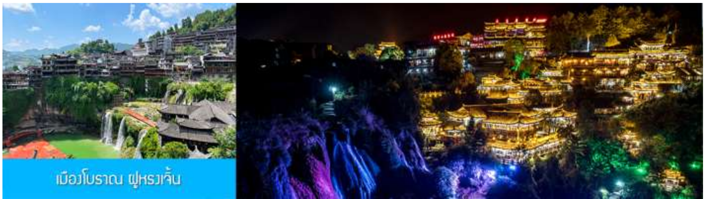
เมืองโบราณ ฟูหวางเจี้ยน

ขอดนิยมนำนักท่องเที่ยว.....นำท่านเดินชมจุดที่น่าสนใจต่าง ๆ ของเมืองโบราณฟูหวางเจี้ยน อาทิ สะพานคู่ หวางเจียว 土王桥 จุดชมวิวน้ำตกท้ายหมู่บ้าน 瀑布观景台 ทางเดินรอดน้ำตก 瀑布走道 (ท่านที่ต้องการไป เดินบริเวณทางเดินรอดน้ำตก ควรมีความพร้อมที่จะต้องเดินขึ้น ลงบันได้หลายสิบชั้น) ท่านสามารถชมการ แสดงพื้นเมือง ณ ลานกิจกรรมบริเวณทางเข้าหมู่บ้าน.... (ค่าทัวร์รวมค่ารถกอล์ฟรับ ส่งจากลานจอดรถไปยัง ทางเข้าอุทยาน)