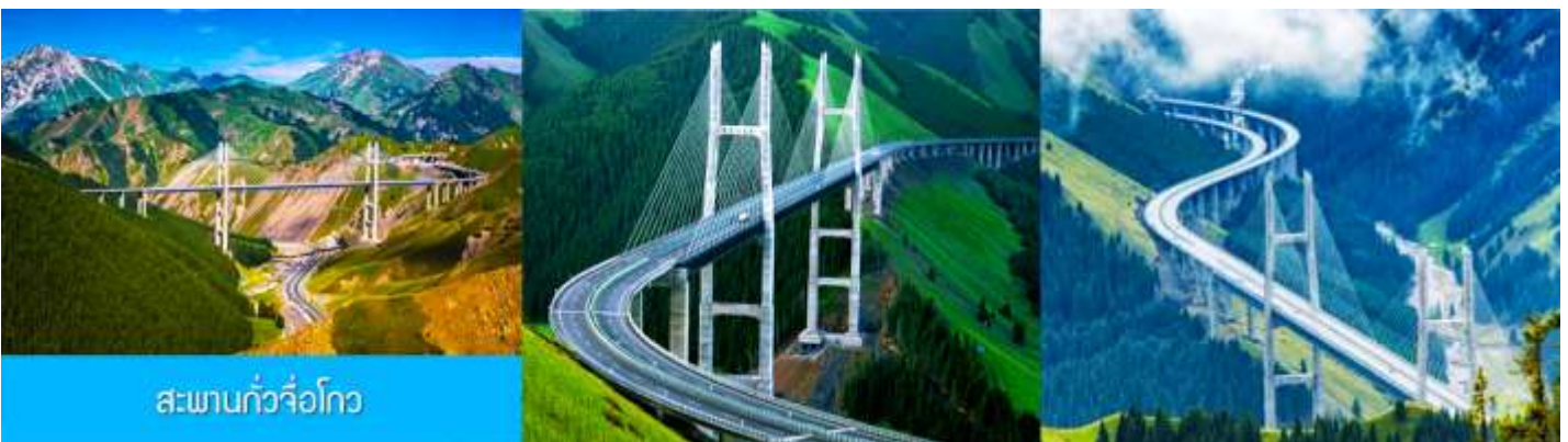
สะพานกั้วจื่อโกว

หลังอาหารเช้าท่านเดินทางโดยรถบัสสู่ ตำบลนำลาถิ 那拉提 (ระยะทาง 300 กม. ใช้เวลาเดินทางราว 4 ชั่วโมง)