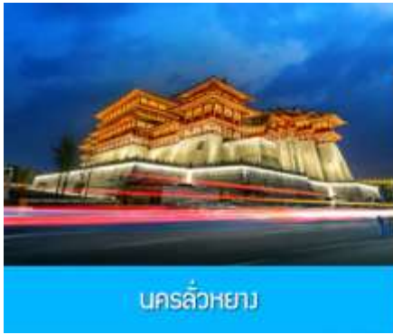
นครลั่วหยาง