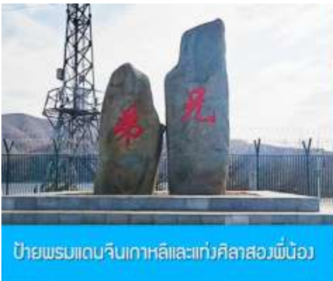
ป้ายพรมแดนจีนเกาหลีและแท่งศิลาสองพี่น้อง