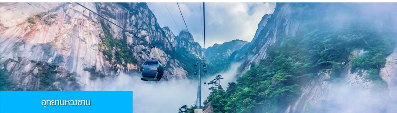
อุทยานหวางซาน