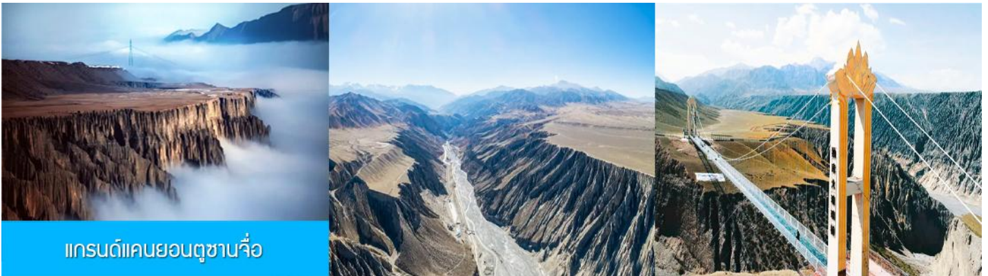
แกรนด์แคนยอนตูซหานจื่อ