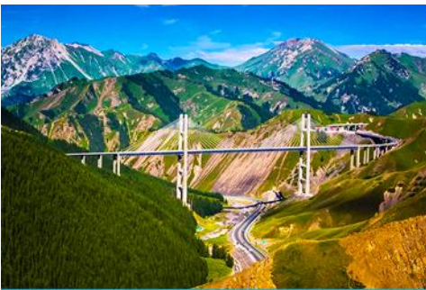
สะพานกั๋วจื่อโกว

หลังอาหารเช้าท่านเดินทางโดยรถบัสสู่ ตำบลนำลาถิ 那拉提 (ระยะทาง 300 กม. ใช้เวลาเดินทางราว 4 ชั่วโมง)