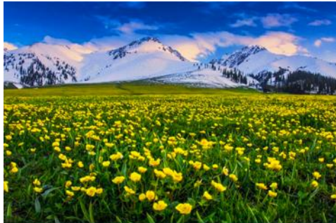
ทุ่งหญ้าลวยฟ้านาลาถิ

พักที่ WAN SEN HOTEL ระดับ 4 ดาวท้องถิ่นในตำบลนาลาถิ