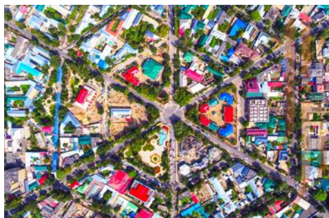
ถนนหกเหลี่ยม

จากนั้นนำท่านเดินทางสู่ เมืองอิหนิง 伊宁 (ระยะทาง 200 กม. ใช้เวลาเดินทางราว 3 ชั่วโมง)