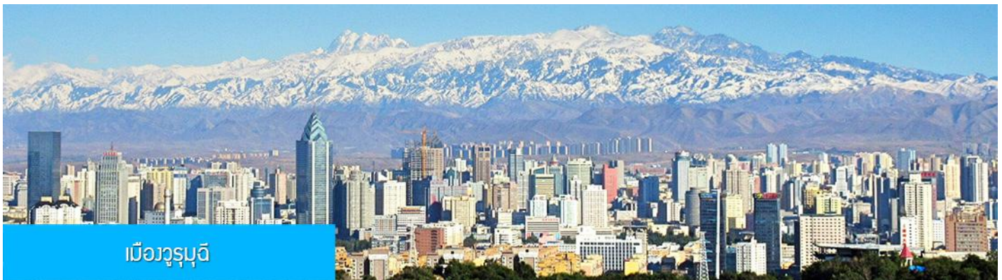
เมืองวูรูมูฉี