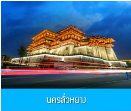
นครลั่วหยาง