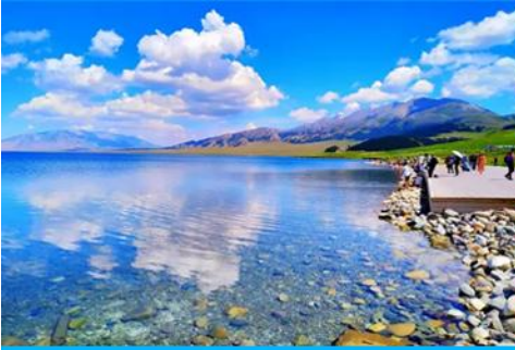
ทะเลสาบไซ่หลี่มู่หู

พักที่ XIHAI LIJING HOTEL ระดับ 4 ดาวท้องถิ่นหรือเทียบเท่าในเมืองบัวเล่อ