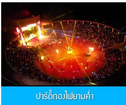
ปาร์ตี้กองไฟยามค่ำ