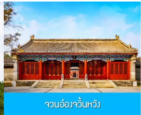
จวนอ๋องจวินหวัง

วันที่หก เมืองเออร์ดอส –อี้เค้อเอ๋่าเป่า–พิพิธภัณฑ์เครื่องเงิน-จวนอ๋องจวินหวัง- สวนวัฒนธรรมหมงกู่หยวน หลิว- ช้อปปิ้งถนนคนเดิน