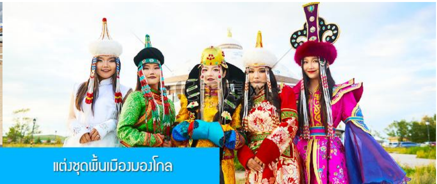
แต่งชุดพื้นเมืองมองโกล