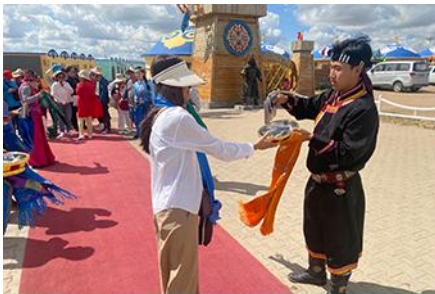
พิธีต้อนรับแขกด้วยเหล้า

รับประทานอาหารกลางวัน ณ ร้านอาหารพื้นเมืองในเขตอุทยาน (8)