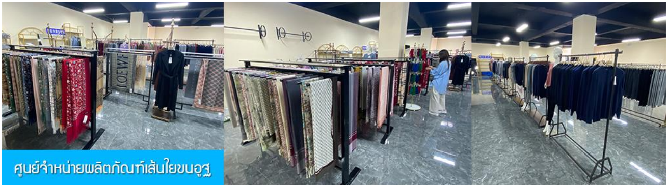
ศูนย์จำหน่ายผลิตภัณฑ์เส้นใยขนอูฐ

พักที่ ORDOS GLASSLAND MONGOLIAN YURT เป็นห้องพักสไตล์มองโกเลียน (กระโจม)