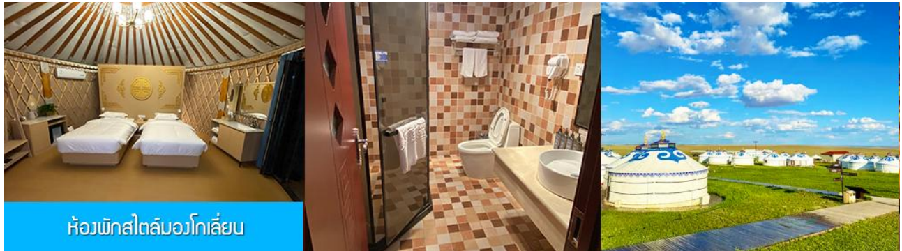
ห้องพักสไตล์มองโกเลียน