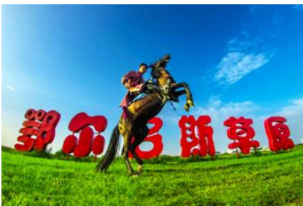
ทุ่งหญ้า เออร์ดอส

พักที่ ORDOS BOYU AIRUI HOTEL โรงแรมระดับ 4 ดาวท้องถิ่น หรือเทียบเท่าในเมืองเออร์ดอส