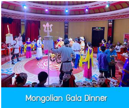
Mongolian Gala Dinner

那达慕 Naadam Festival หรือเทศกาลเฉลิมฉลองที่คล้ายวันตรุษจีนของชาวจีนอื่น ประกอบด้วยกิจกรรมพื้นเมืองแบบมองโกลรวม 22 อย่าง ได้แก่ พิธีแต่งงานเออร์คอส / การขี่ม้าในสนาม / ปาร์ตี้รอบกองไฟ / ขี่ม้าถ้ำรูป / สไลเดอร์หญ้า / รถลางทุ่งหญ้า / สวนแขวงกต / สวนเด็กเล่น / ดิกอล์ฟทุ่งหญ้า / รถบัมเปอร์ / รถโกคาร์ต / โยนบอลทุ่งหญ้า / ปีนไฟมองโกล / ยิงธนูในร่ม / แข่งขันจับแกะ / คลั่งม้าจำลอง / หมูเลี้ยงนำเอ็นดู / เครื่องเล่นหมุน / เลี้ยงแกะโยน / ยิงธนู / ทอยแจกัน / เซ็นต์ชื่อภาษามองโกลให้เด็กเล่นได้ 12 อย่างตามรายการที่ระบุ.....อัตราค่าบริการสำหรับ 那达慕 Naadam Festival 380 หยวน หรือ 1,900 บาท/ท่าน (สำหรับลูกค้าที่ซื้อโปรแกรมเสริม สามารถเดินเล่น ถ้ำรูปบริเวณทุ่งหญ้าหรือพักผ่อนตามอัชฌาศัย)