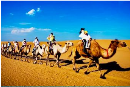
เป็นทรายเลียงขาว