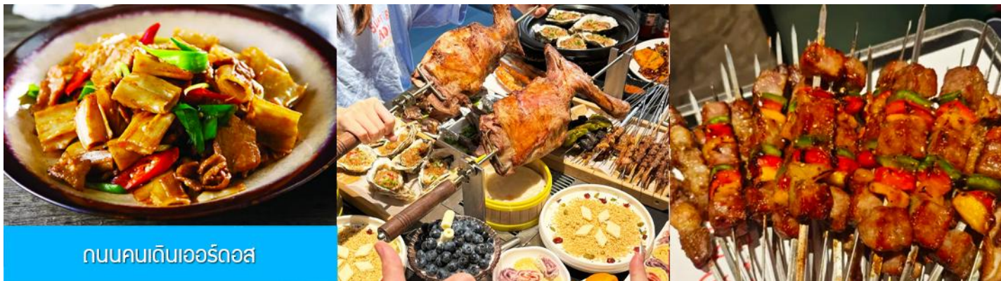
ถนนคนเดินเออร์ดอส

นำท่านเที่ยวชม สวนวัฒนธรรมหมงกู่หยวนหลิว 蒙古源流 เป็นอุทยานท่องเที่ยวเชิงประวัติศาสตร์และวัฒนธรรมระดับ 4A ของจีน ที่เป็นต้นกำเนิดของชนชาติและวัฒนธรรมมองโกล สะท้อนความเป็นจักรวรรดิที่ยิ่งใหญ่เมื่อ 700 ปีก่อน ชม ประตูจงเทียน 崇天门 สุคนโหฬารที่แสดงถึงความยิ่งใหญ่ของจักรวรรดิมองโกล ชม จัตุรัสเถิงเก้อหลี่ 腾格里广场 จัตุรัสกลางแจ้งขนาดใหญ่ที่ใช้ประกอบพิธีกรรมต่าง ๆ