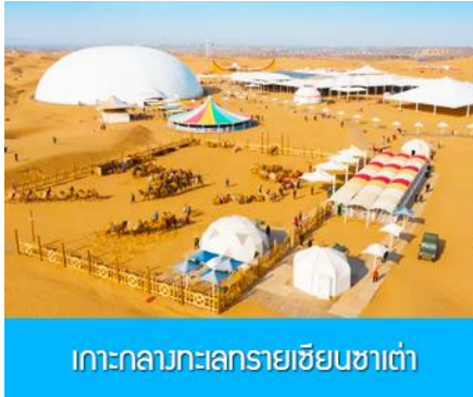
เกาะกลางทะเลทรายเซียนซาเต๋า