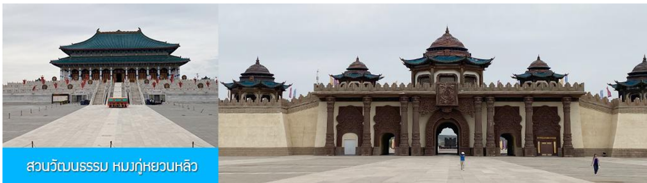
สวนวัฒนธรรมหมงกู่หยวนหลิว

หลังอาหารนำท่าน เที่ยวชม จวนอ๋องจวิ้นหวัง 郡王府 จวนแห่งนี้เริ่มสร้างขึ้นในปี ค.ศ. 1902 สร้างเสร็จในปี ค.ศ. 1936 เป็นที่พำนักของ อ๋องอิฉีจวิ้นหวัง 伊旗郡王 เป็นจวนอ๋องเพียงหนึ่งเดียวที่ได้รับการอนุรักษ์ในสภาพที่สมบูรณ์ โครงสร้างทำด้วยอิฐ หิน และไม้ ประกอบด้วยห้องพัก 16 ห้อง เป็นสถาปัตยกรรมผสมแบบมองโกล ทิเบต และฮั่น