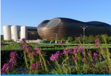
อุทยานคังปาสือ