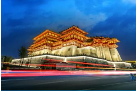
นครลั่วหยาง