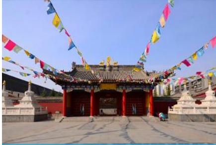
วัดลามะกว่างเหริน