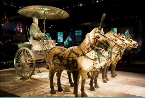
สุสานกองทัพทหารม้าจีน