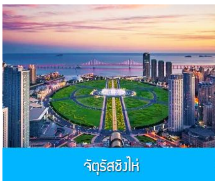
จัตุรัสชิงไห่

เช้า รับประทานอาหารเช้า ณ ห้องอาหารของโรงแรม (1)