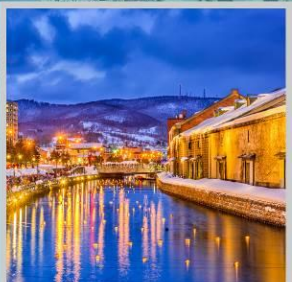
“OTARU CANAL FEST”