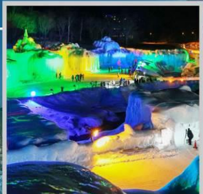
“SOUNKYO ICE FEST”