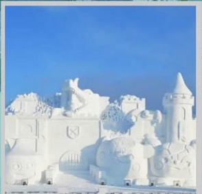
“ASAHIKAWA SNOW FEST”