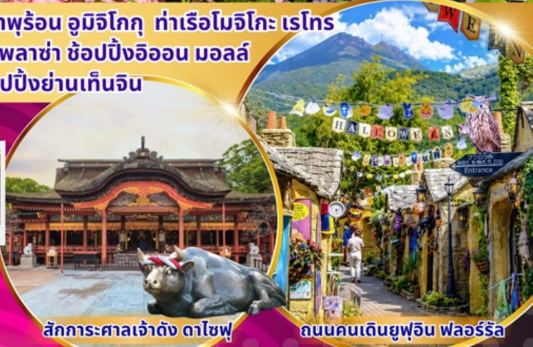
สักการะศาลเจ้าดัง ดาไซฟู