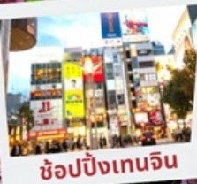
ช้อปปิ้งเทนจิน