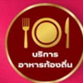
บริการ อาหารท้องถิ่น