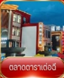
ตลาดตาราเตอ์อี