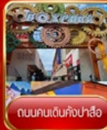
ถนนคนเดินคังปาซือ