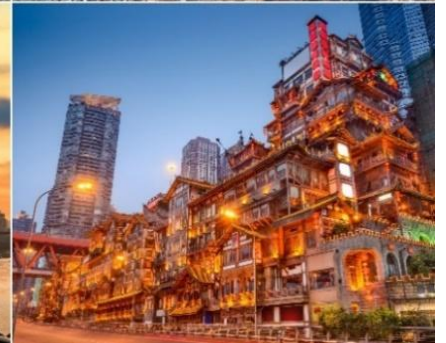
อิสระอาหารค่ำ ตามอัธยาศัย