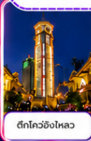
ตึกโควอชิงไหลว