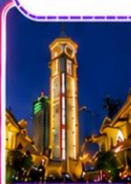
ตึกไควอิ่งไหลว