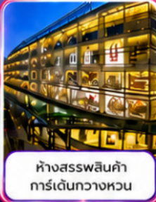
ห้างสรรพสินค้า การเดินทวงหวน