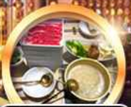
บุฟเฟ่ต์ชาบู เบื่อไม่อั้น!!