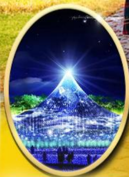
Nabana No Sato