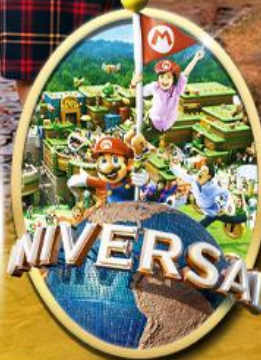
อิสระเลือกซื้อบัตร Universal Studios Japan