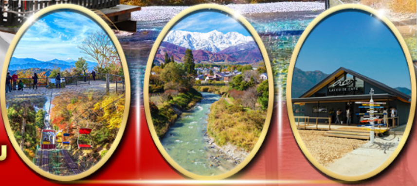
ภูเขา ทาคาโอะ ไอโอดีพาร์ค Ao Lakeside Cafe