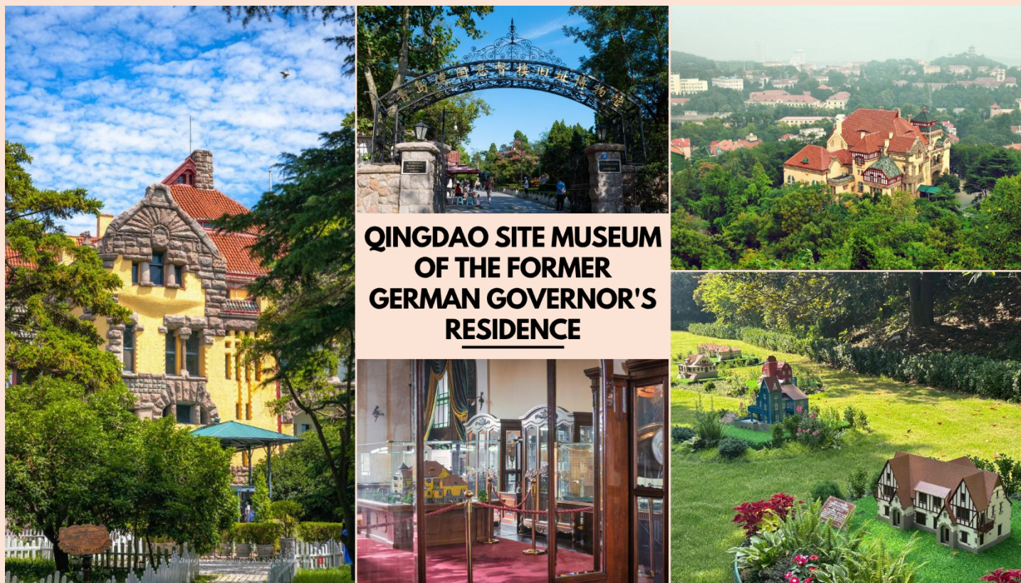
QINGDAO SITE MUSEUM OF THE FORMER GERMAN GOVERNOR'S RESIDENCE