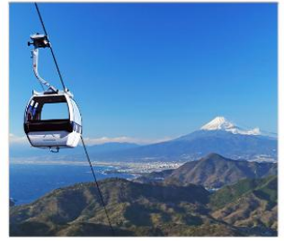
ชิบุพานิรามาริว