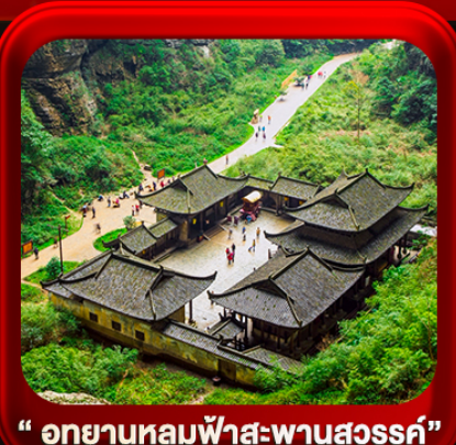
“ อุทยานหลุมฟ้าสะพานสวรรค์ ”