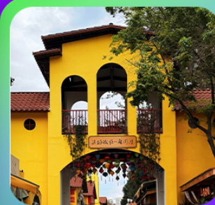
“หมาหยวนมิเตอร์กจ”