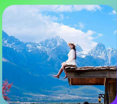
“กาแฟ Yun Di An Coffee”