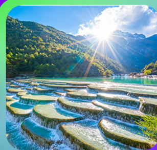
“ทะเลสาบโป้ซุยเหอ”