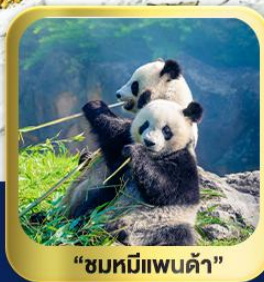
“ชมหมีแพนด้า”