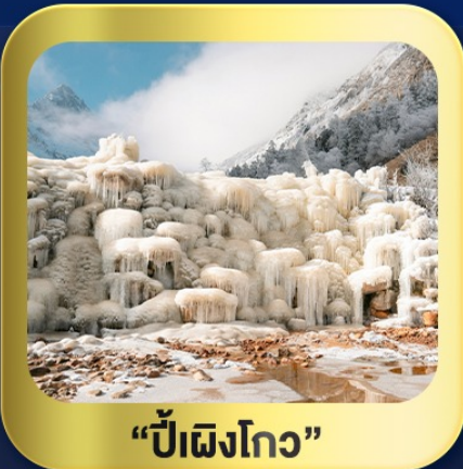
“ปี้เฉิงโกว”

นั่งกระเช้าชมวิว ภูเขาหิมะ-ต้ากู่กลาเซียร์ • ชมความสวยงาม ณ อุทยานปี้เฉิงโกว ห้องสมุดจงซูเก๋อ • ศูนย์หมีแพนด้า • ตงเจียวจี้อี้ • ซอยกว้างชวยແคบ