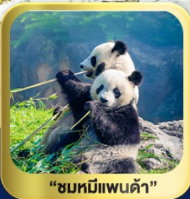
“ชมหมีแพนด้า”