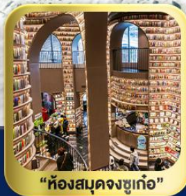
“ห้องสมุดจงซูเก๋อ”