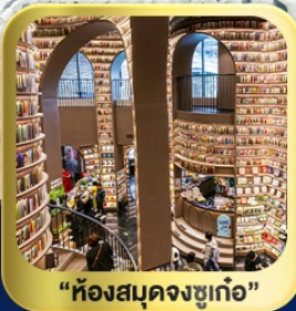
“ห้องสมุดจงซูเก๋อ”