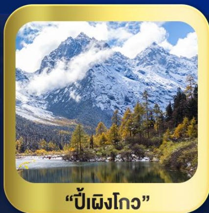
“ปี้ผิงโกว”