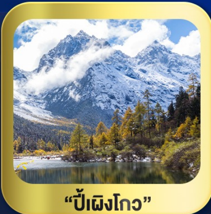
“ปี้เฉิงโกว”