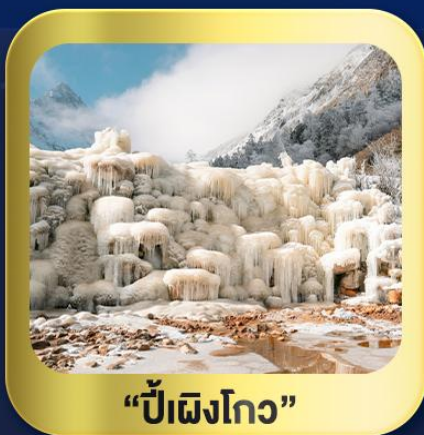
“ปี้ผิงโกว”

นั่งกระเช้าชมวิว ภูเขาหิมะ-ต้ากู่กลาเซียร์ • ชมความสวยงาม ณ อุทยานปี้ผิงโกว ห้องสมุดจงซูเก๋อ • ศูนย์หมีแพนด้า • ตงเจียวจี้ • ซอยกว้างชวยແคน