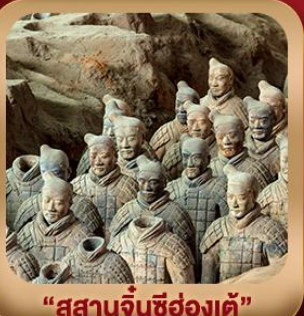
“สุสานจิ้นซีฮ่องเต้”