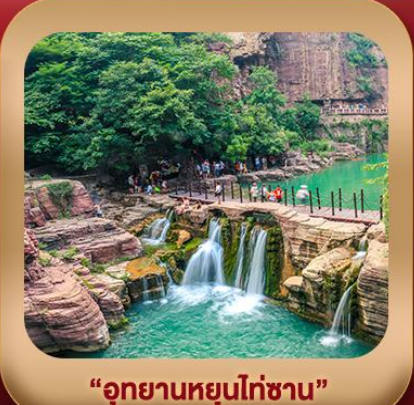
“อุทยานหยุนไต้ซาน”

ชมถ้ำหลงเหมิน มรดกโลกที่เมืองลั่วหยาง • สุสานจิ้นซีฮ่องเต้ • ศาลเจ้ากวนอู วัดเส้าหลิน + ป่าเจดีย์ + ชมโชว์กังฟู • เมืองโบราณลั่วอี้ • อุทยานหยุนไต้ซาน เจดีย์ห่านป่าใหญ่ • ถนนวัฒนธรรมต้าถัง • ถนนคนเดินอิสลาม • จัตุรัสหอระบิง