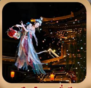
“เมืองโบราณลั่วอี้”