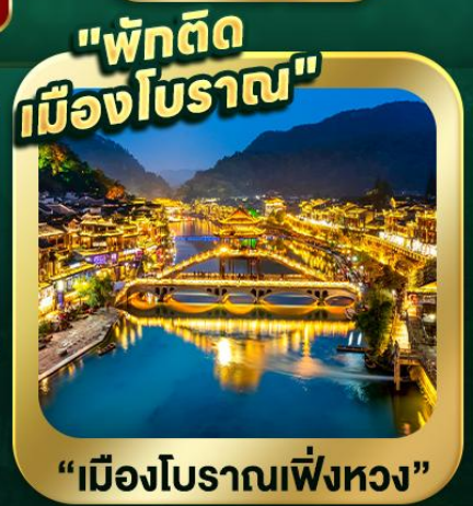
"พักติด เมืองโบราณ"