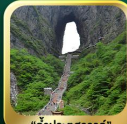
"กำแพงคูสวอรัค"