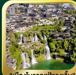
"เมืองโบราณฟูหรงเจิ้น"