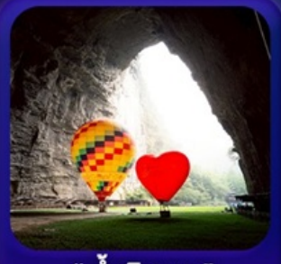
“ ถ้ำดึงหลง ”