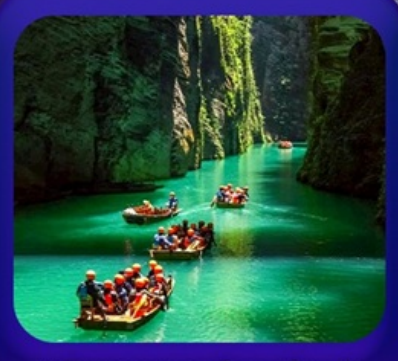
“ ผิงซานแกรนด์แคนยอน ”

เที่ยวจีน 2 มณฑล เสว่น+หูเป่ย์ • ถ้ำดึงหลง • หุบเขาสิงโต ซื่อจื่อกวน ล่องเรือมังกรกังสุ่ยชมวิวยามค่ำคืน • ผิงซานแกรนด์แคนยอน (รวมล่องเรือ) หงหยาดัง • จุดชมรถไฟฟ้าทะลุติ๊ก • ตึกตะเกียบ • สือปาตี้ • หลงเหมินฮ่าว