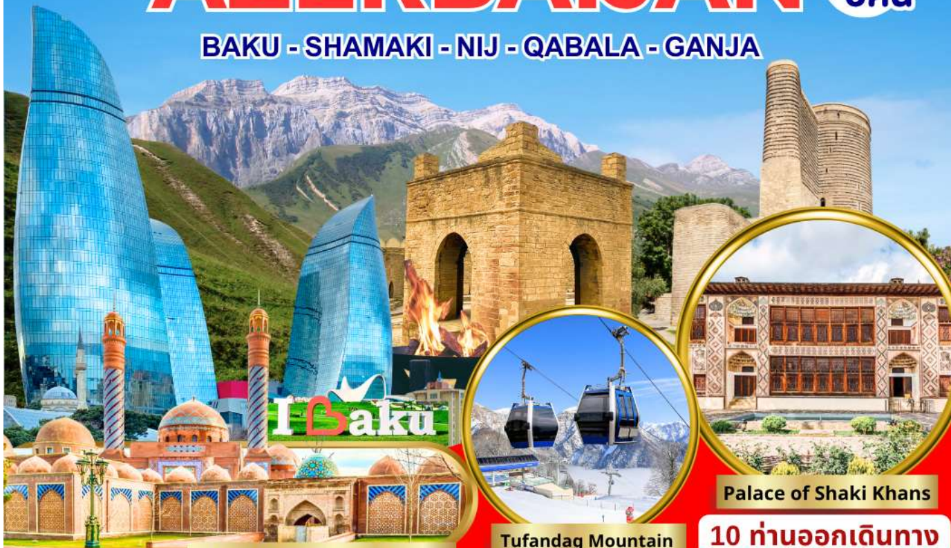
Masjid Imamzadeh Ibrahim