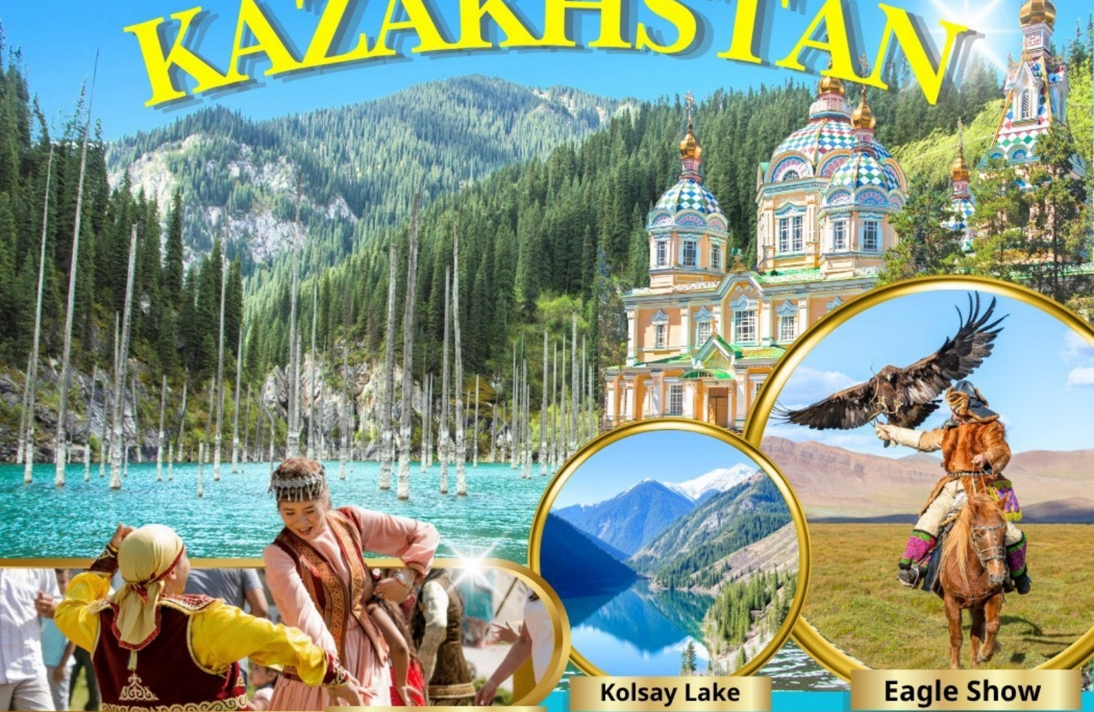
Huns Ethno Village