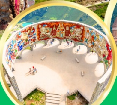
Russian-Georgian Friendship Monument