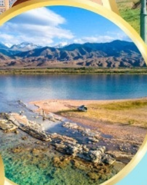
ล่องเรือทะเลสาบอิสซิค