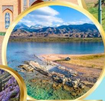
ล่องเรือทะเลสาบอิสซิค