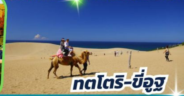
ทตโตริ-ซึอูจึ