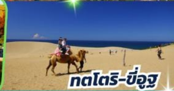
ทตโตริ-ซึจูกู