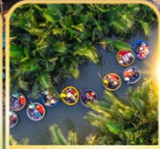
น้ำร้อนกระดัง