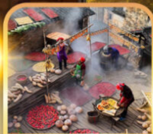
หมู่บ้านโบราณหวงหลิง