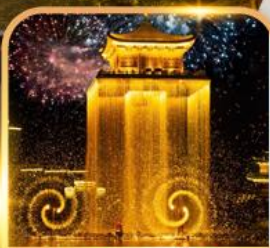
ชมโชว์อุ๊หนี่โจว