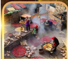
หมู่บ้านโบราณหวงหลิ่ง