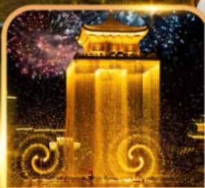
ชมโชว์อุหนี่โจว