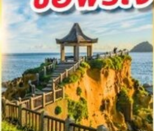
เกาะเหอผิง

พักย่านซีเหมินติง 2 คืน ขอพรเจ้าแม่กวนอิมพันมือ