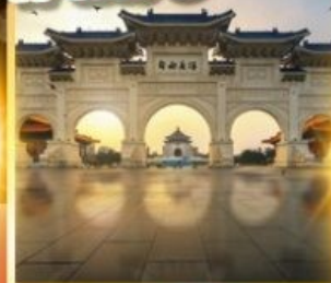
อนุสรณ์เจียงโตเซค